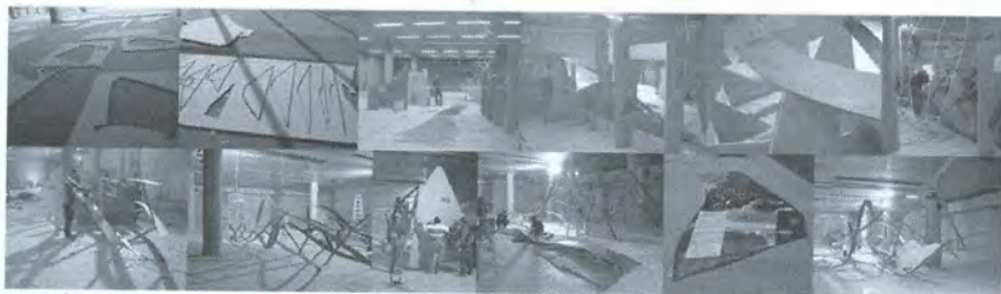
φωτ. 2 κατασκευή και συναρμολόγηση της εγκατάσταση anima_ta