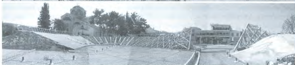
φωτ. 2,3 κεντρική πλατεία «Παραμάνη» του Δήμου Θέρμης