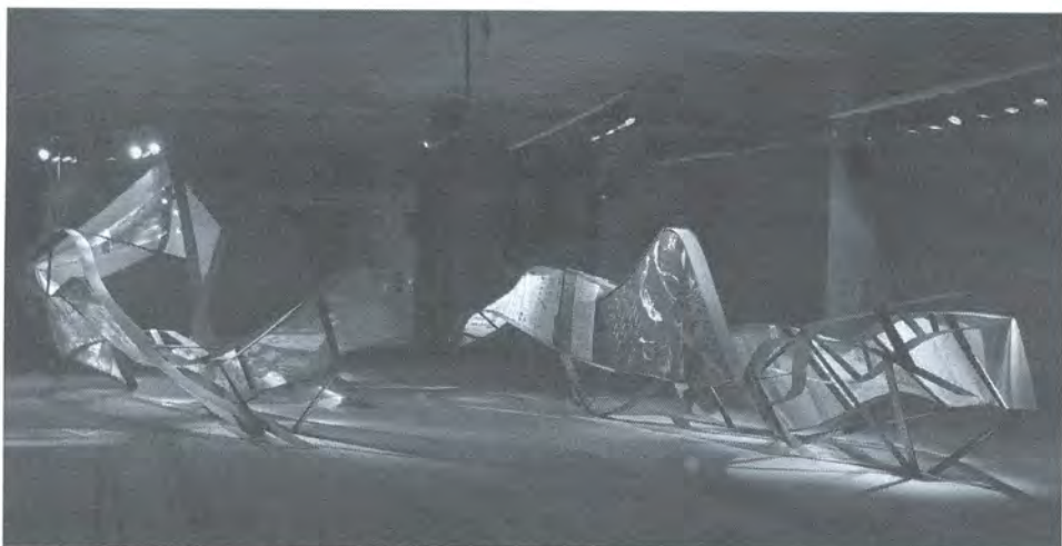
φωτ. 1 πειραματική αρχιτεκτονική εγκατάσταση anima_ta